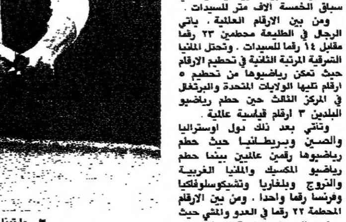
مارتينا نغرا لياوفا